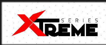
Imagen de Referencia. La información de este documento puede cambiar sin previo aviso.

KTC presenta la Serie Xtreme, nuestro tope de gama en maquinaria agrícola e industrial diseñada para cumplir con las demandas más rigurosas de sectores y clientes especializados. Con un compromiso inquebrantable con la calidad, rendimiento, eficiencia y durabilidad, la Serie Xtreme supera los ya elevados estándares de los productos KTC, llevándolos a nuevos límites y consolidando nuestra posición en la vanguardia de la innovación.